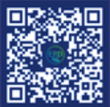
微信公众号二维码