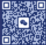
微信小助手二维码

EPD促进中心 EPD Promotion center 电话:19038257301(同微信)