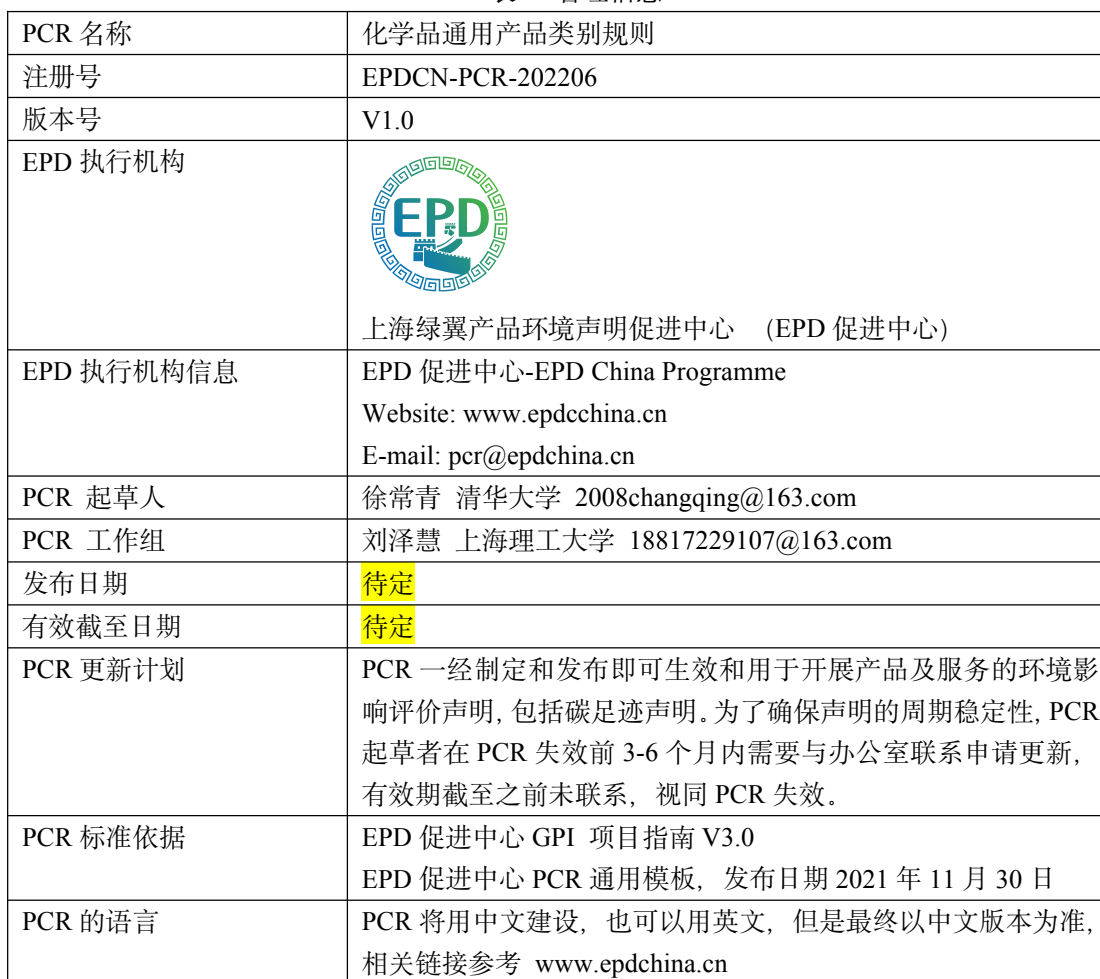
表 2 管理信息